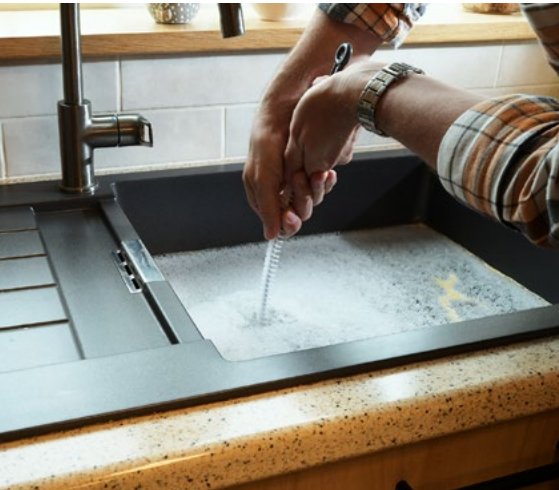
EIN VERSTOPFTER ABFLUSS beschäftigte auch die AK.