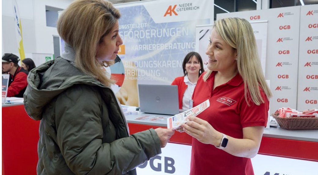
Eine interessierte Besucherin informiert sich am „Tag der Weiterbildung“ im ANZ St. Pölten.

Erfolgreicher „Tag der Weiterbildung“ in St. Pölten